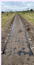
にんにく植え付け終了

畑や田圃の作物をこちらにも分けてほしいと言ってくださいました。ますます多くのみなさんのご期待にこたえるよう土さんと対話したいと思