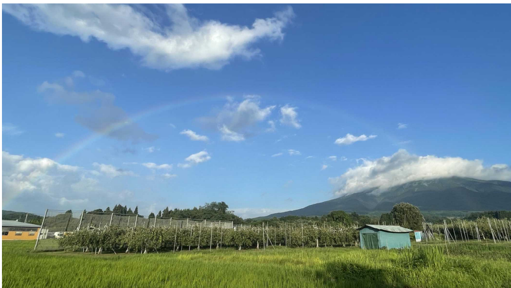
お山 と 田畑と 虹