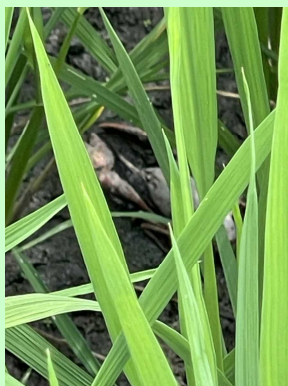
稲の陰のザリガニ

なぜ羨ましかったかというと、ザリガニが動き回ると土をかき回して水を濁らせるからです。水が濁ると水中の草が発芽できなくなったり、草の成長を遅らせます。「ザリガニが畔に穴をあけちゃうのよねー」と農園主は笑っていました。明らかに草対策を人間の代わりにやってくれている。ホタルさんはきてくれたけど、いつかうちの田んぼにザリガニさんも来てくれなかな。ただニホンザリガニだとしたら「特定第二種国内希少野生動物種」なので捕獲したり売買などした場合、個人では五年以下の懲役か五〇〇万円以下の罰金、だとか。(二〇二三年閣議決定)なんでも閣議ですぐ決まるのね。