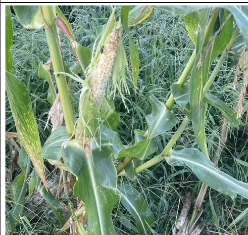
たぬきさん、きれいに食べています！

別名「スイートコーン」ですが、甘さでは津軽名産のとうもろこし「獄きみ」には及びません。でも雑味がなく自然栽培らしくあっさりしています。タヌキの食べ残しで小さいですが、味わってみてください。